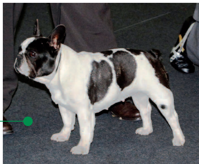
Afrodite del Solgimar (All. e Prop. All.to del Solgimar) BOB alla Mostra Speciale di Genova